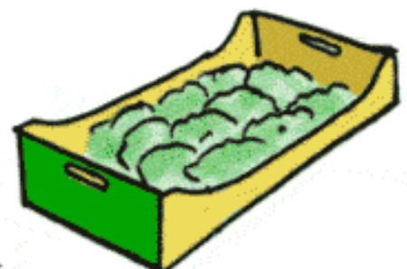
Légumes frais Légumes crus prêt à l'emploi Légumes cuits sous vide prêt à l'emploi