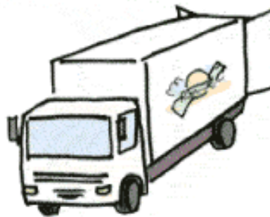
Station de réception des légumes bruts